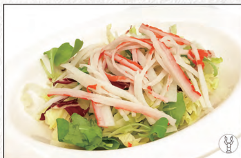
13/ INSALATA MISTA CON GRANCIO* €5,00