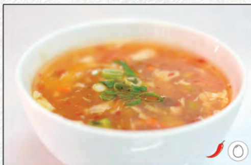
17/ ZUPPA AGROPICCANTE €3,00