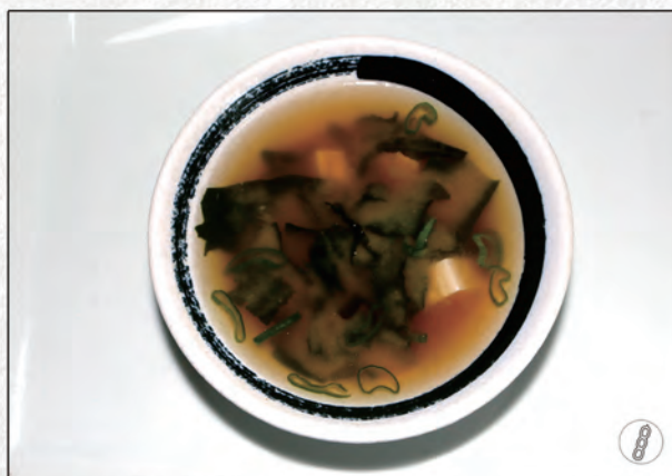
15/ ZUPPA DI MISO €2,50 alghe e tofu