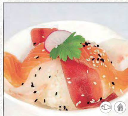
87/ CHIRASHI MISTO €10,00