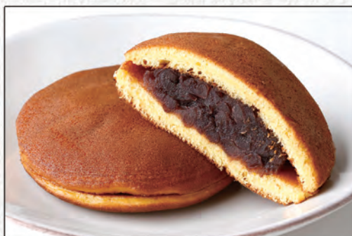
179/ DORAYAKI €4,00 (pancake con crema di fagiolini rossi)