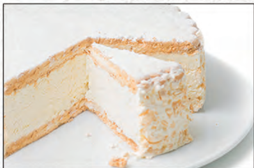
176/ MERINGATA €3,50