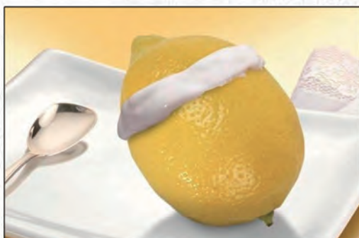
186/ LIMONE RIPIENO €4,00