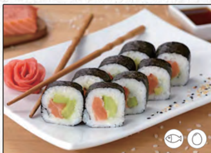
81/ FUTO SALMONE €9,00 salmone, avocado, maionese