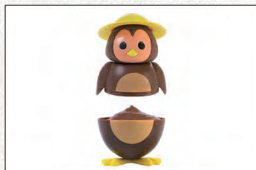
189/ CIP CIOK €4,50 (gelato al cioccolato)