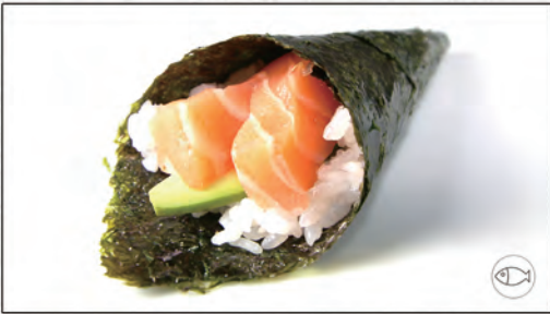
98/ SAKE €4,00