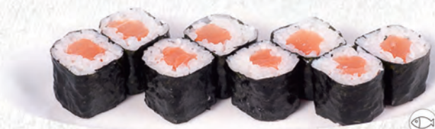
26/ SAKE €4,00 salmone