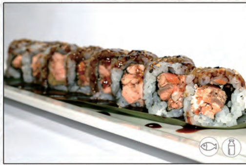
67/ MIURA ROLL €8,00 salmone grigliato, philadelphia