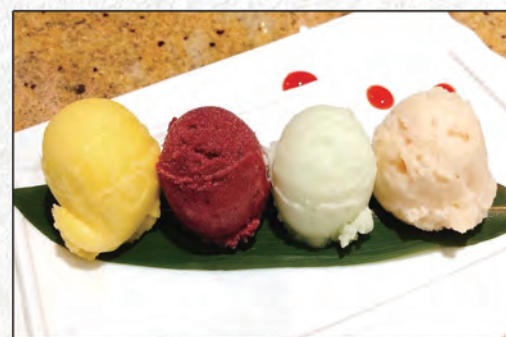
187/ SUSHI DESSERT €4,00 (sorbetti ai diversi gusti)