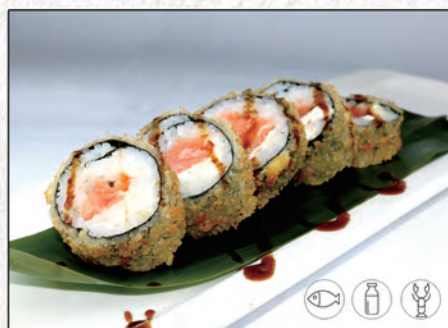
84/ FUTO FRITTO €9,50 philadelphia, surimi di granchio*, salmone