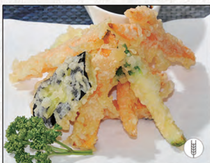
171/ TEMPURA VERDURE €5,00