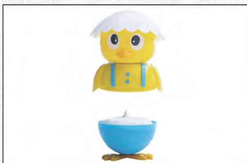
188/ TWITTY €4,50 (gelato al fiordilatte)