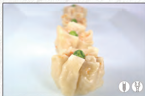
05/ RAVIOLI DI GAMBERO AL VAPORE* €3,50