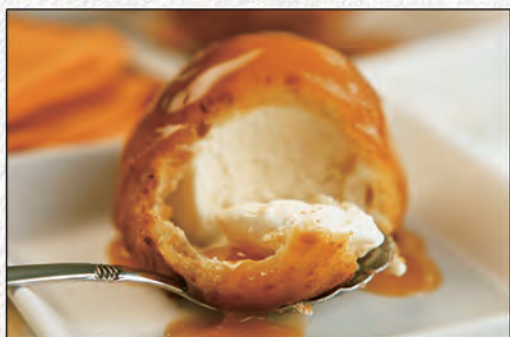
182/ GELATO FRITTO €3,50