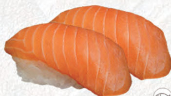
39/ SALMONE €3,00