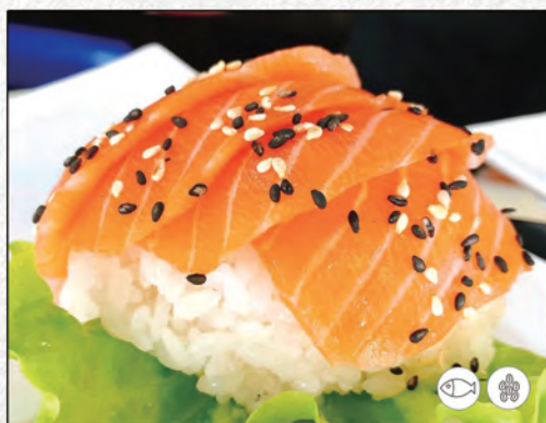
85/ SAKE DON €10,00 salmone