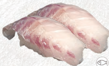
41/ PESCE BIANCO €3,50