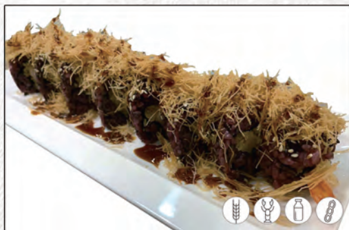
78/ BLACK ANGEL ROLL €10,00 riso venere con gamberi* fritti, philadelphia, kataifi e teriyaki