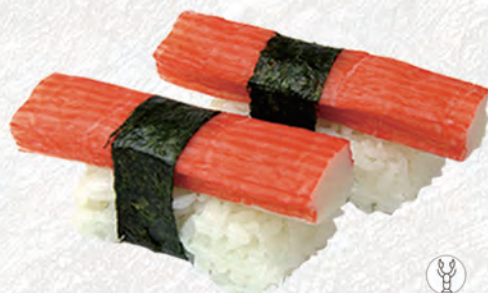
43/ SURIMI DI GRANCHIO* €3,00