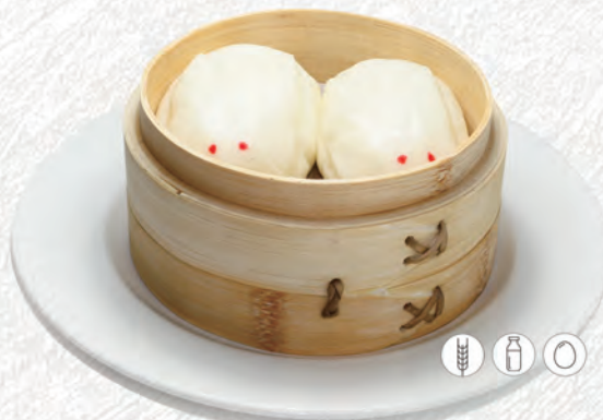
09/ PANE AL VAPORE RIPIENO DI CREMA* €3,00