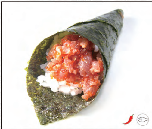
102/ SPICY TUNA €4,00