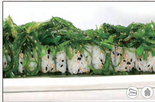
77/ VEGETARIANO €8,00 avocado, cetriolo, insalata, rivvolti con wakame