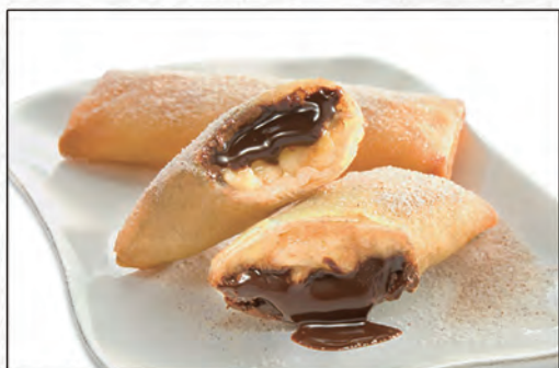
178/ NUTELLA HARUMAKI €4,00 (involtini di nutella)