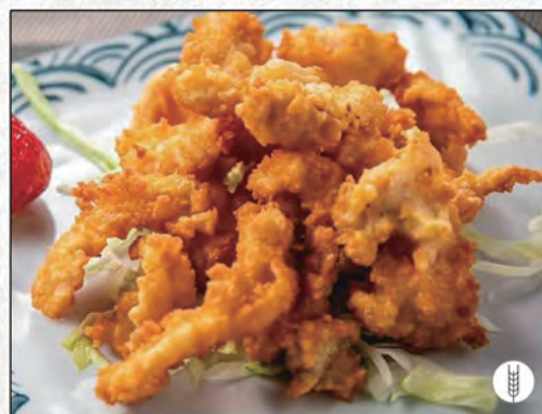
173/ TEMPURA POLLO €6,00