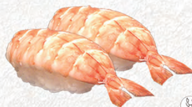
42/ GAMBERO COTTO* €3,00