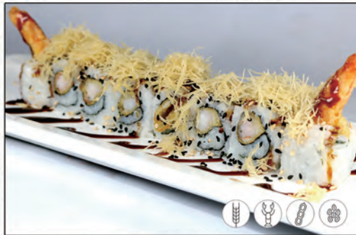
69/ EBITEN €8,00 interno gamberi* fritti guarnito con salsa teriyaki e kataifi