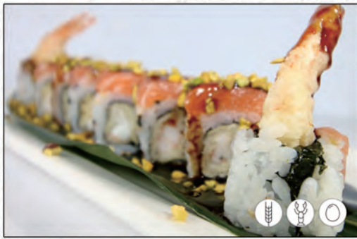
65/ TIGER ROLL €10,00 gambero* fritto, maionese, granella di patate, salmone