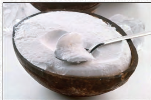
185/ COCCO RIPIENO €4,00