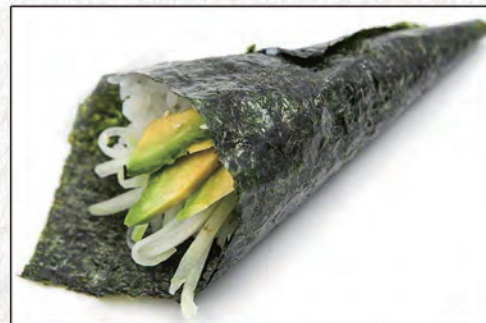
103/ YASAI €3,50