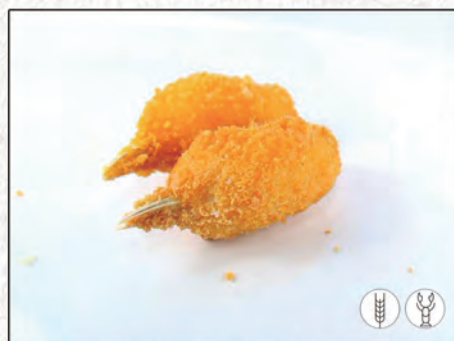
03/ CHELE DI GRANCHIO* €4,00