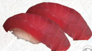
40/ TONNO €4,00