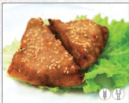
08/ TOAST DI GAMBERI* €3,50