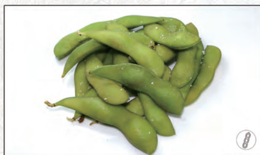
07/ EDAMAME* €4,00 fagiolini di soia