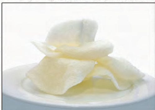
10/ NUVOLETTE DI DRAGO €2,50