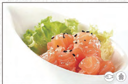
19/ TARTAR DI SALMONE €7,00 (Max 3 porzioni a persona)