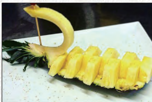
181/ FRUTTA FRESCA €3,50 (macedonia)