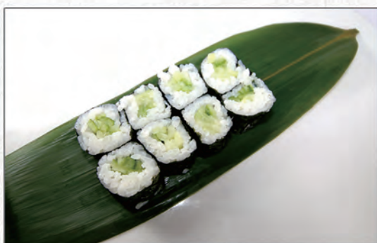
29/ KAPPA €3,50 cetriolo