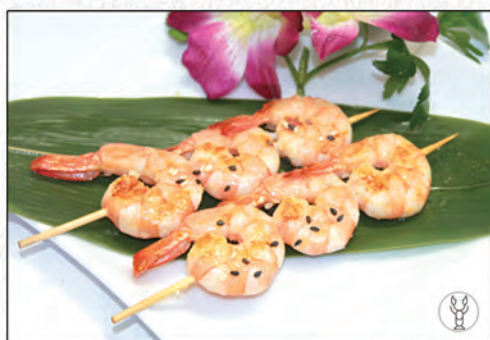
161/ SPIEDINI DI GAMBERI* €7,00 (Max 3 porzioni a persona)