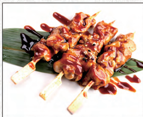
162/ SPIEDINI DI POLLO €6,00 (Max 3 porzioni a persona)