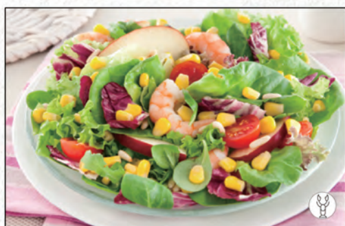
12/ INSALATA MISTA CON GAMBERI* €5,00