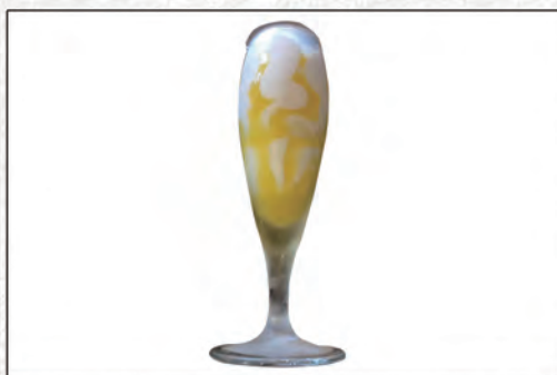
183/ FLUTE LIMONCELLO €5,00