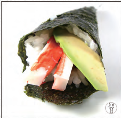
100/ CALIFORNIA* €4,00