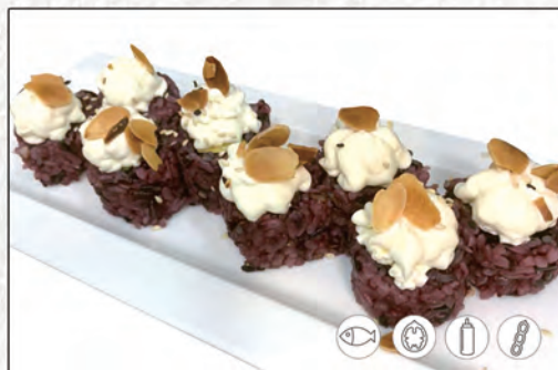
80/ BLACK MANDORLE €9,00 riso venere con salmone, avocado, philadelphia, mandorle e teriyaki