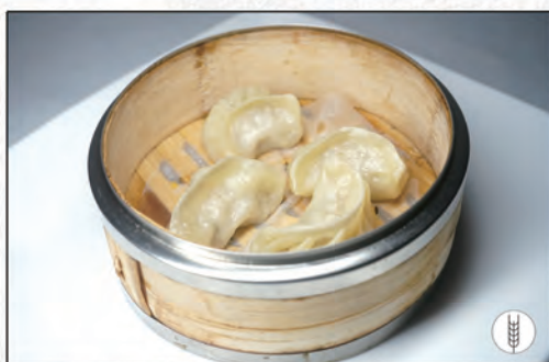
04/ RAVIOLI DI CARNE AL VAPORE* €3,00