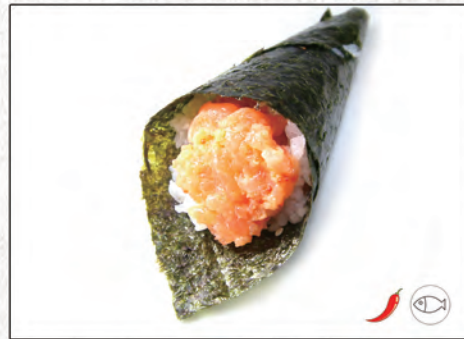
101/ SPICY SAKE €4,00