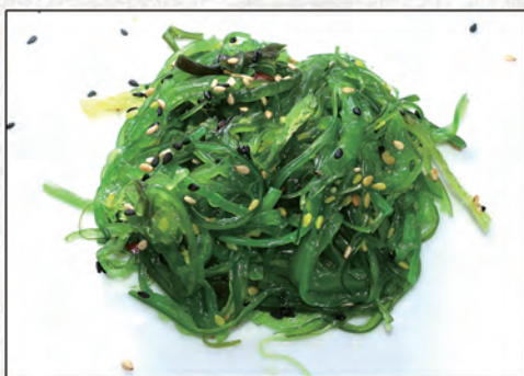
06/ WAKAME €4,00 alghes giapponesi