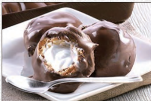
177/ PROFITEROL BIANCO E NERO €4,00