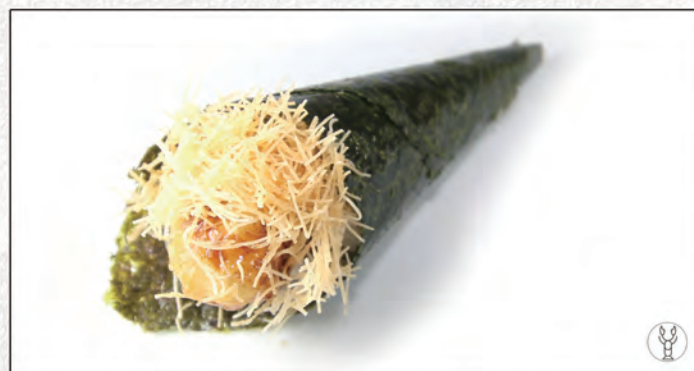
104/ EBITEN* €4,00