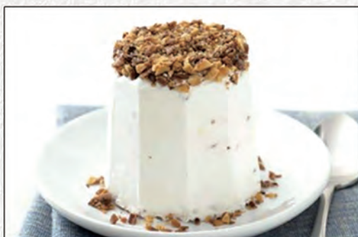
190/ SEMIFREDDO AL TORRONCINO €4,50