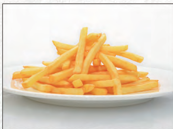
175/ PATATINE FRITTE €3,00