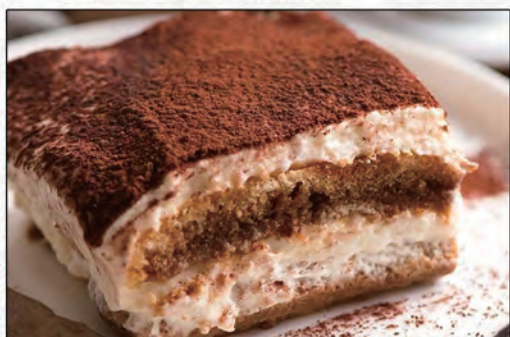
180/ TIRAMISÙ €4,00