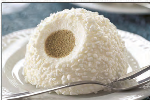
184/ TARTUFO BIANCO E NERO €4,00