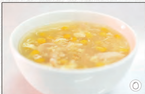
16/ ZUPPA DI MAIS E POLLO €3,00