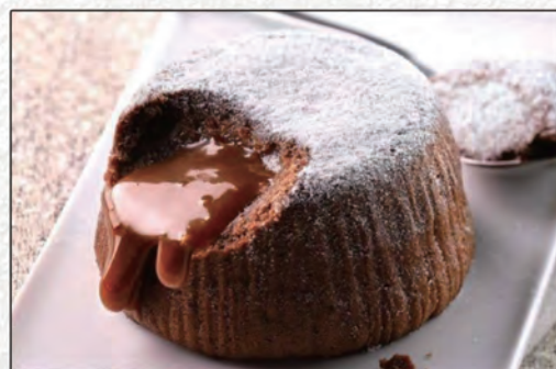
191/ SOUFFLE CIOCCOLATO €4,50