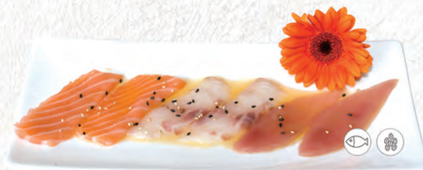
25/ CARPACCIO MISTO €7,50 (Max 3 porzioni a persona)