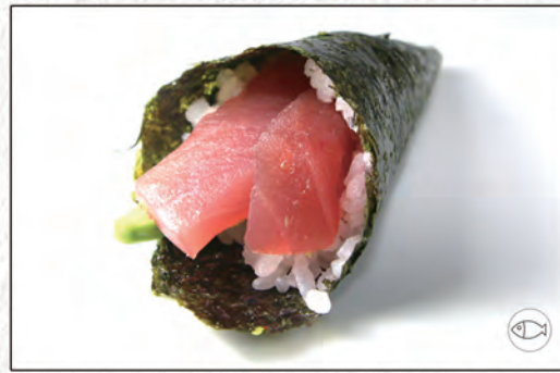
99/ TEKKA €4,00