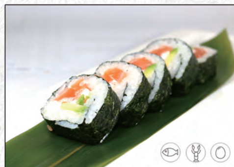
83/ FUTO CALIFORNIA* €9,00 avocado, salmone, surimi di granchio*, maionese