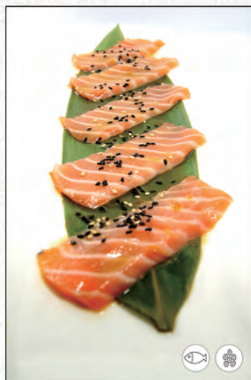
22/ CARPACCIO DI SALMONE €7,00 (Max 3 porzioni a persona)