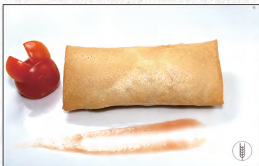
01/ INVOLTINO PRIMAVERA* €3,00